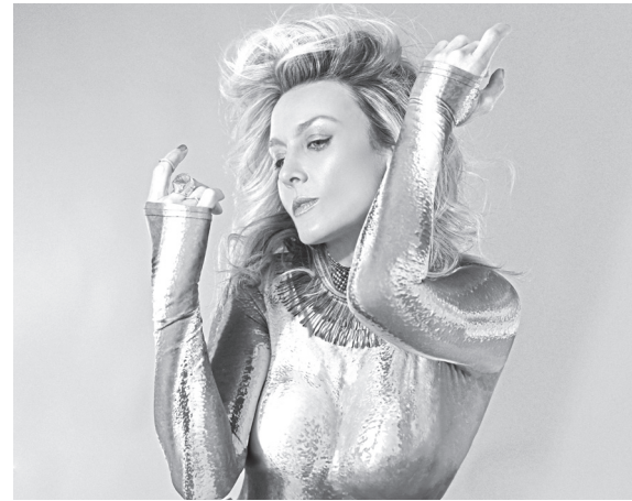
La artista celebra tres décadas sobre los escenarios.